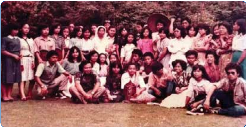
Gambar 2.5 Peserta Didik Melaksanakan Retret