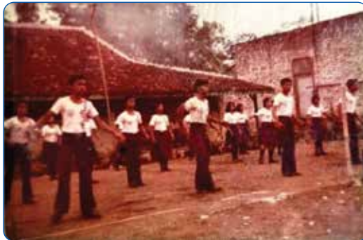
Gambar 2.2 Peserta Didik SPG Sanjaya Melakukan Olahraga Senam.