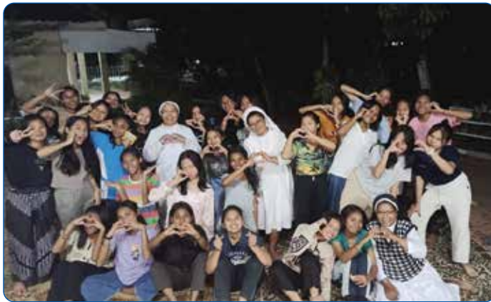
Gambar 3.8 Harmoni Kehidupan Asrama Putri Santo Dominikus Wonosari

Asrama Putri Santo Dominikus Wonosari merupakan fasilitas hunian khusus bagi siswi yang dikelola oleh Yayasan Santo Dominikus dan terintegrasi dengan SMA Dominikus Wonosari.