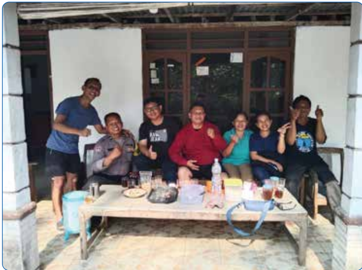
Alumni SMA Dominikus Tahun 1997 Guyub Rukun dalam Menguatkan dan Menghibur Teman Seangkatan yang Sedang Berduka.