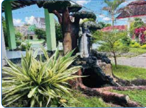
Gambar 2.6 Taman Santo Dominikus di SMA Dominikus Wonosari