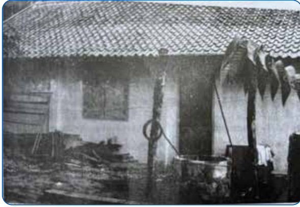
Gambar 3.10 Biara Santo Dominikus Wonosari Ketika Masih Mengontrak