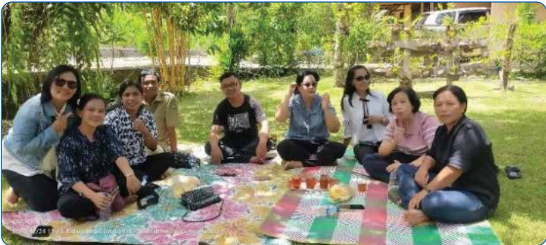
Foto-foto keguyuban Alumni 1997 di sela-sela kesibukan untuk bertemu dan berdinamika bersama.