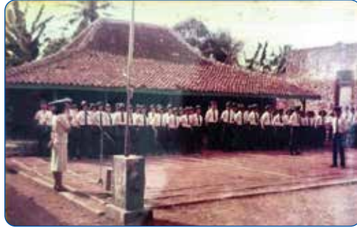
Gambar 2.3 Peserta Didik SPG Sanjaya Melaksanakan Apel