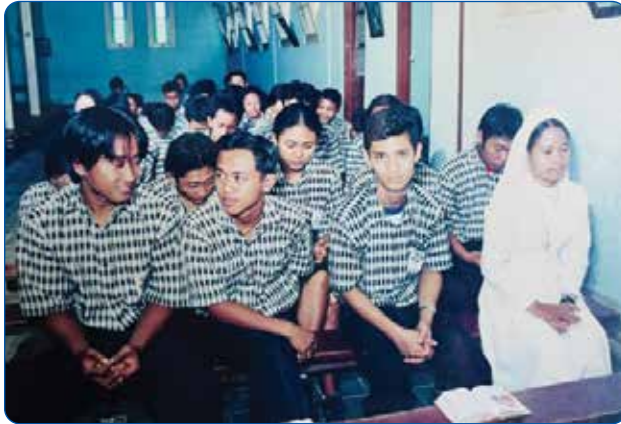
Gambar 2.12 Suster OP Mendampingi Peserta Didik

(Kebenaran), pewartaan, dan pelayanan melalui pendidikan. Spirit inilah yang kemudian menjadi jiwa SMA Dominikus. Pendidikan tidak hanya dipahami sebagai proses transfer pengetahuan, melainkan pembentukan pribadi yang utuh, cerdas, dan cinta kebenaran.