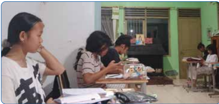
Gambar 3.9 Di ruang belajar Asrama Putri Santo Dominikus Wonosari

Asrama ini dirancang sebagai lingkungan yang aman dan kondusif, dengan penekanan pada pembentukan karakter, kedisiplinan, kehidupan doa, serta semangat persaudaraan. Kehadiran asrama ini tidak hanya menjadi solusi atas keterbatasan akses geografis, tetapi juga menjadi sarana pembinaan yang mendukung perkembangan pribadi dan spiritual peserta didik. Saat ini pengelolaan asrama dipercayakan kepada Sr. M. Gabriella, OP.