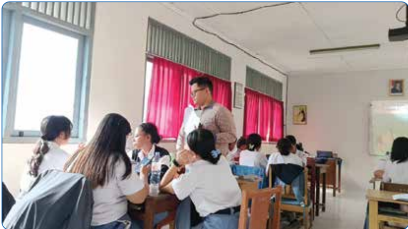
Gambar 3.13 Aktivitas Pembelajaran di Kelas

Tantangan utama pada masa ini bersifat krusial dan berskala global, yaitu mitigasi learning loss akibat pandemi Covid-19 yang berdampak langsung pada proses pembelajaran. Kondisi tersebut mendorong pemerintah untuk menerapkan Kurikulum Darurat dengan penyederhanaan materi esensial, yang kemudian diformalisasi dalam kebijakan Merdeka Belajar melalui penerapan Kurikulum Merdeka. Kurikulum ini menekankan pembelajaran berdiferensiasi serta penguatan karakter melalui Proyek Penguatan Profil Pelajar Pancasila (P5). Selain itu, terjadi pula perubahan kebijakan evaluasi pendidikan nasional dengan dihapuskannya Ujian Nasional dan digantikan oleh Asesmen Nasional sebagai instrumen pemetaan mutu pendidikan.