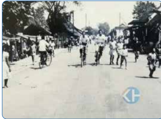
Gambar 2.8 Kondisi Sosial-Ekonomi Masyarakat Kabupaten Gunungkidul Tahun 1900-an.

Berdasarkan informasi yang kami dapatkan, di Kabupaten Gunungkidul jumlah sekolah menengah atas pada akhir dekade 1980-an masih terbatas. Sekolah negeri menjadi pilihan utama masyarakat karena dianggap lebih mapan dari segi fasilitas, pembiayaan, dan legitimasi. Di Wonosari, sebagai ibu kota kabupaten, hanya terdapat beberapa SMA yang telah lebih dahulu berdiri, sementara pilihan sekolah swasta masih sangat sedikit. Kondisi ini menyebabkan daya tampung pendidikan menengah atas belum sepenuhnya sebanding dengan jumlah lulusan SMP yang terus meningkat setiap tahun.