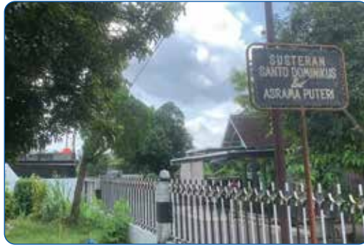
Gambar 3.7 Susteran Santo Dominikus dan Asrama Putri

NTT, Papua, dan lain-lain. Upaya ini didukung oleh para Suster Ordo Pewarta (OP) di Wonosari melalui penyediaan fasilitas pendukung berupa Asrama Putri Santo Dominikus Wonosari.