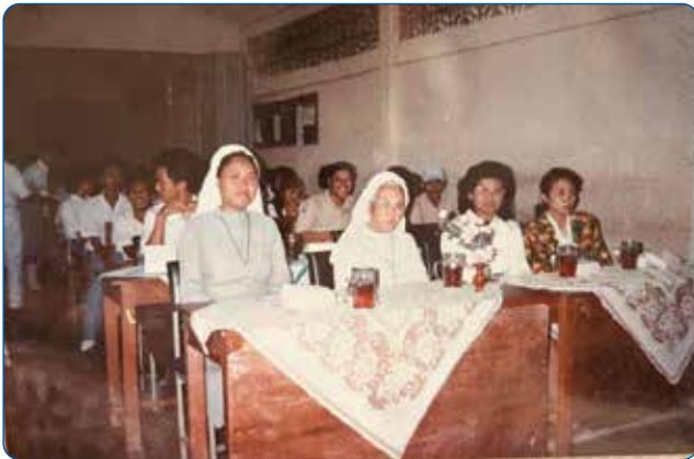
Gambar 2.11 Suster OP Bersama Peserta Didik

Berdirinya SMA Dominikus Wonosari juga tidak dapat dilepaskan dari peran penting Suster-suster Dominikan yang tergabung dalam Yayasan Santo Dominikus Kantor Cabang Yogyakarta. Kehadiran mereka tidak hanya sebagai pengelola administratif, tetapi sebagai motor penggerak visi dan arah pendidikan yang kemudian menjadi fondasi karakter sekolah.