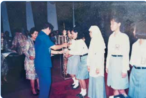
Gambar 2.10 Peserta Didik Meraih Prestasi dalam Lomba Paduan Suara

Dengan demikian, kondisi pendidikan SMA di Wonosari pada tahun 1989 dapat dipahami sebagai fase transisi dan kebutuhan yang mendesak. Di satu sisi, terdapat keterbatasan jumlah sekolah dan daya tampung; di sisi lain, terdapat peningkatan aspirasi masyarakat untuk memperoleh pendidikan yang lebih tinggi bagi generasi muda. Situasi ini menciptakan ruang historis bagi lahirnya lembaga pendidikan menengah atas baru yang mampu memperluas akses sekaligus memberikan alternatif pendidikan berbasis nilai.