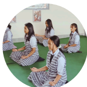
Pendidikan iman dan karakter

Out put SMA Dominikus Wonosari perlu lebih kompetitif di mata masyarakat dengan menyelenggarakan program Double Track Culinary and Entrepreneurship. Program tersebut dapat mengasah keterampilan peserta didik untuk menjawab tantangan zaman yakni lulus dengan keterampilan plus yang bisa membantu ekonomi keluarga atau hidup mandiri. Program ini dilaksanakan dengan melibatkan kerja sama dengan pihak luar yang kompeten di bidang Culinary and Entrepreneurship.